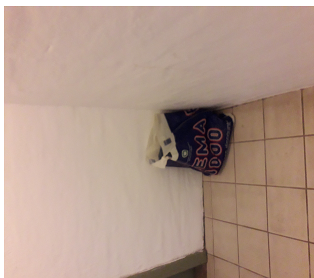
12 august 2020 (samme pose som i juli)