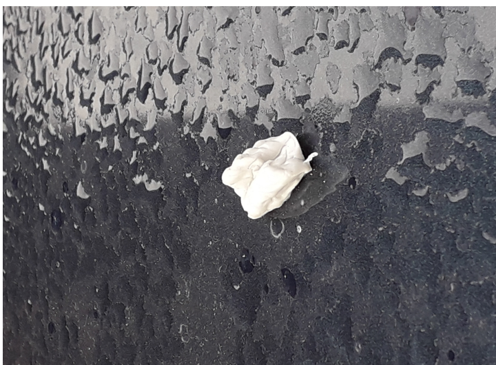
Tyggegummi på min søns bil, billede af 13 oktober 2020