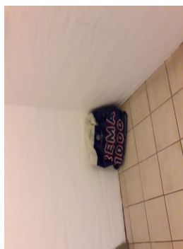
Effekter i kældergang, 21 juli 2020