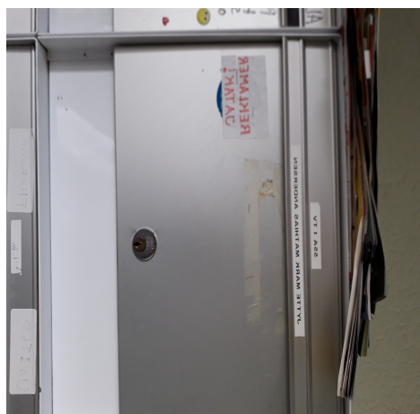
Aviser og reklamer oven på postkasserne, 30 juni 2020 (ikke tilladt jf. brandreglement)

Herunder billeddokumentation, som et udsnit for hvad Hobro Boligforening tillader og- eller ikke holder opsyn med. Der har været meget andet der har været efterladt i kælderen, stakke af reklamer/aviser på postkasserne og manglende oprydning efter brug af vaskerum igennem alle de år vi har boet her. Dette udelukkende for at dokumentere hvad Hobro Boligforening ser igennem fingre med når det gælder andre, for jeg blander mig aldrig i hvad andre foretager sig. Kun efter de klager og advarsler jeg har fået, eller de evige bemærkninger om lys tændt i vaskerummet, da har jeg påpeget andre beboeres adfærd.