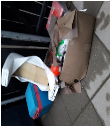
Effekter sat ud ved området for affaldsbeholdere, 21 juli 2020. Det er storskraldeffekter, som vi har fået besked på at beboere selv skal sørge for, ved at ringe til storskrald for at bede dem afhente sådanne ting, da ordningen med at servicemændene tager sig af det, ophørte for nogle år siden.