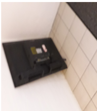
Henstillet fjernsyn i kælder ved dør ud til gårdområde, 21 juli 2020