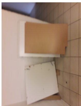
Effekter i kældergang, 21 juli 2020