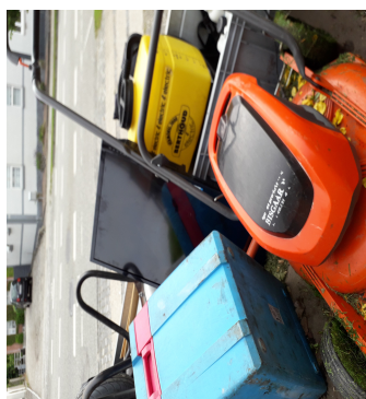
Effekter og fjernsyn på vogn afhentet af servicemand under Hobro Boligforening, 21 juli 2020