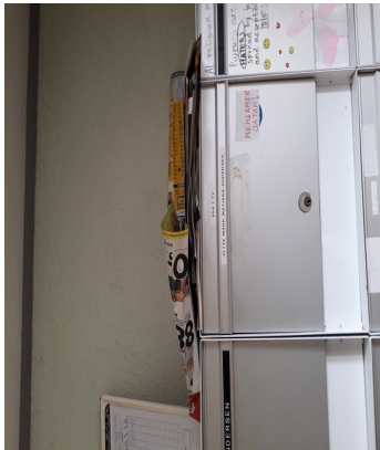
Aviser og reklamer oven på postkasserne, 21 juli 2020 (ikke tilladt jf. brandreglement)