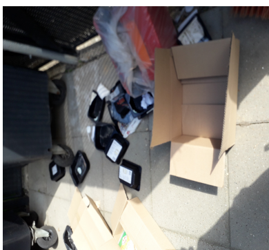
Effekter ved område for affaldsbeholdere, 10 og 12 august 2020