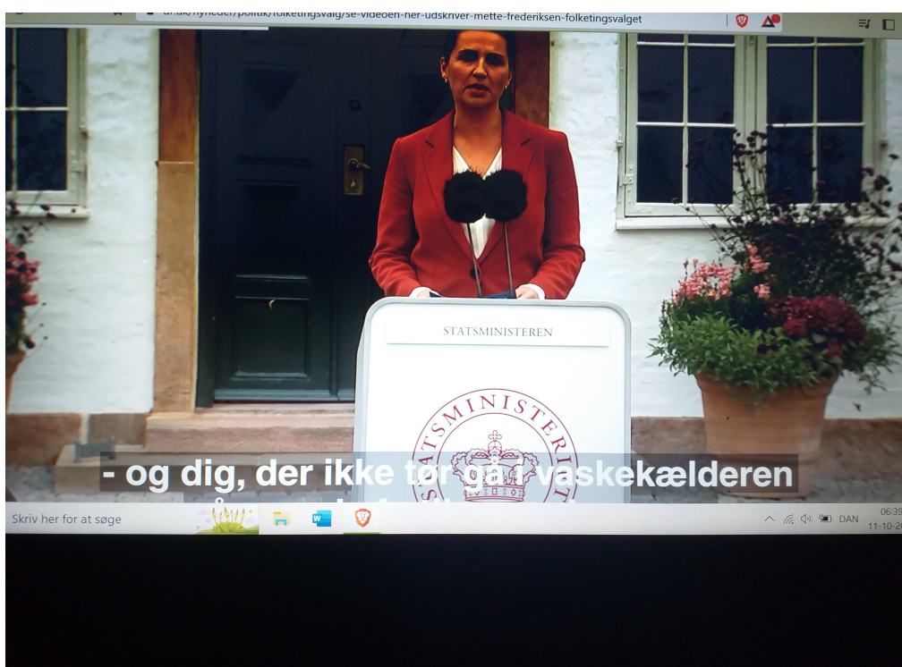
DR, 5 oktober 2022. Mette Frederiksen

Personligt - enormt temperamentsfuld - personangreb: Din #tanke??