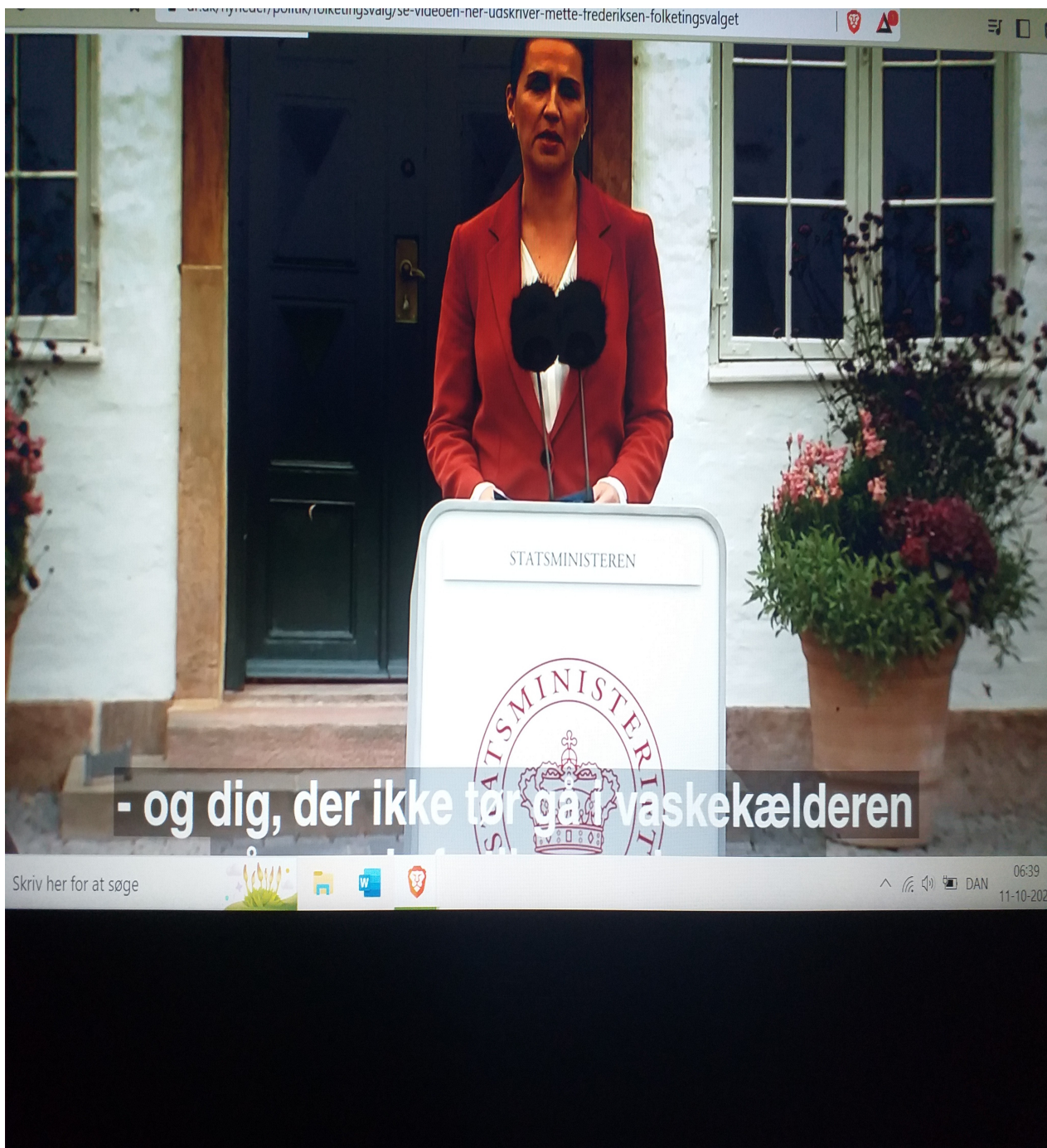
Statsminister i Danmark, MF, DR. 5 oktober 2022