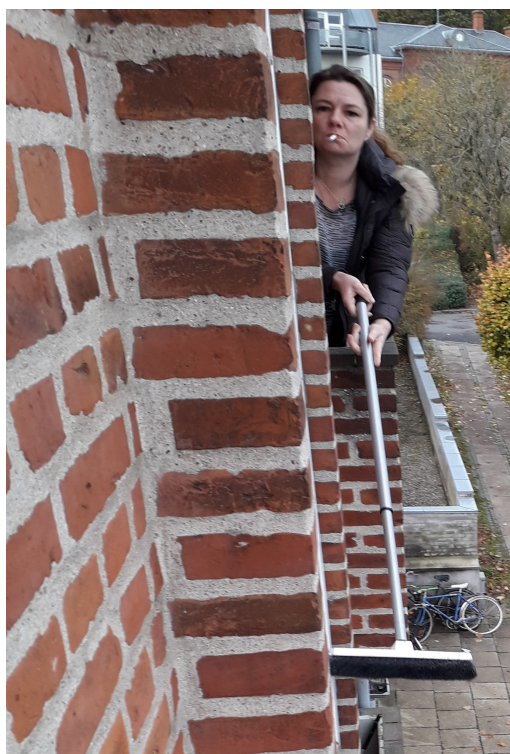
1 november 2020, kl. 12. 39

Har du tidligere været i behandling, i det psykiatriske system??